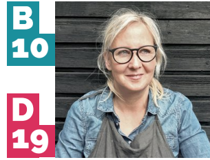
B 10 D 19 Katja Blume »Little Shops in Watercolor«