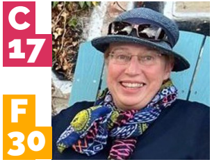
C 17 F 30 BeauxArts –S. Fiedler »Die Schönheit im Verborgenen – Urban Sketching in der Schmutzedecke«